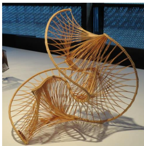
Tissage aérien entre deux tiges métalliques sinueuses. La courbe inspire les créateurs présents.

Les artistes exposés ont suivis une formation traditionnelle de tissage du bambou. Ils savent préparer le bambou pour qu'il puisse être tressé :