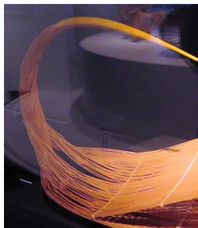
L'extrémité gauche des lamelles est nattée puis fixée à l'intérieur d'un cône effilé et recourbé